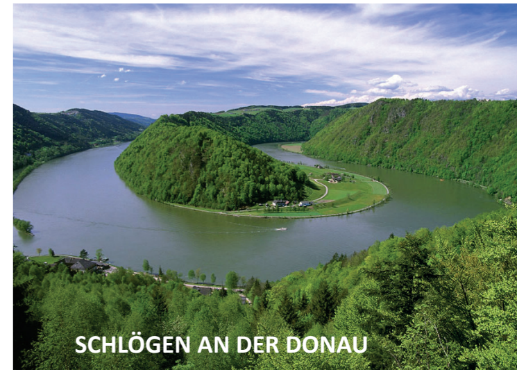
SCHLÖGEN AN DER DONAU